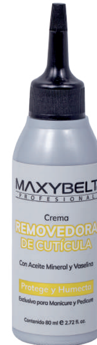
CREMA REMOVEDORA DE CUTÍCULA

Protege y humecta la cutícula. Exclusiva para Manicure y Pedicure.