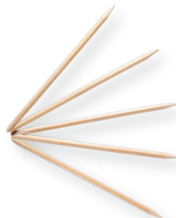
PALITOS DE NARANJO